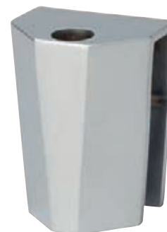
Gâche à répétition 8802