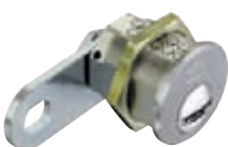
Batteuses p. 77