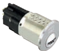
Contacteurs à clé p. 77