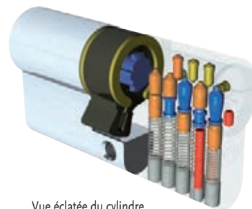
Vue éclatée du cylindre