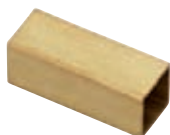
Fourreaux p. 345