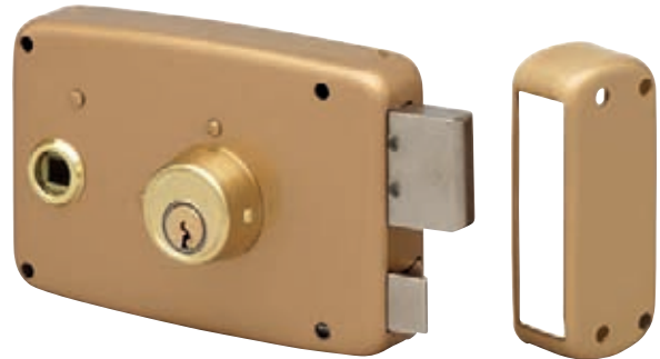
Modèle représenté : droite tirant